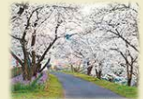
斐伊川堤防桜並木