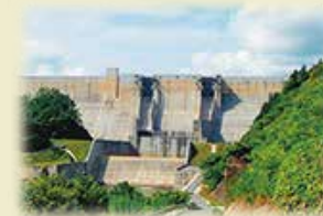
尾原ダム