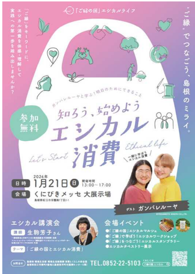
【図1 イベントチラシ】