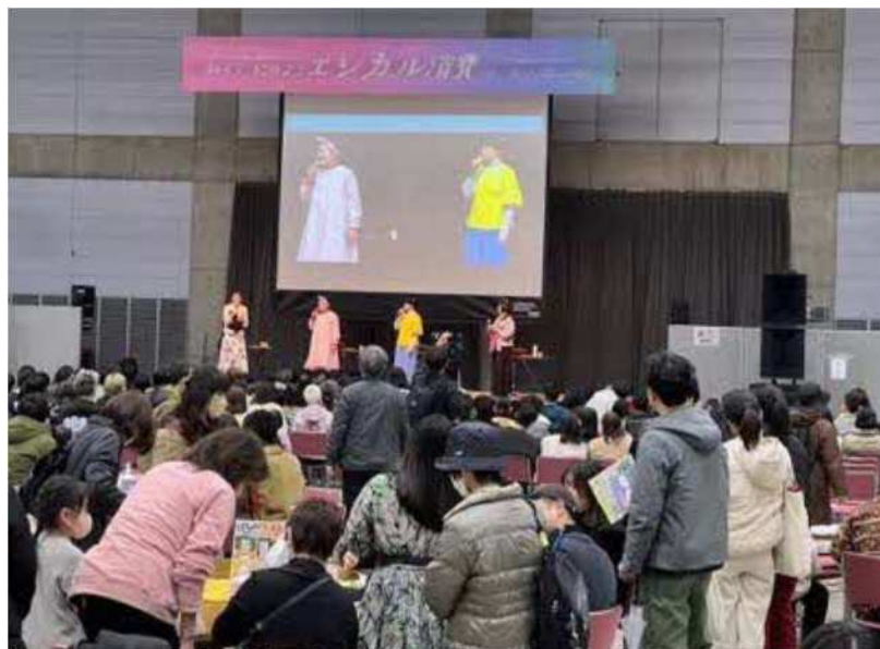
【図2 トークイベント】