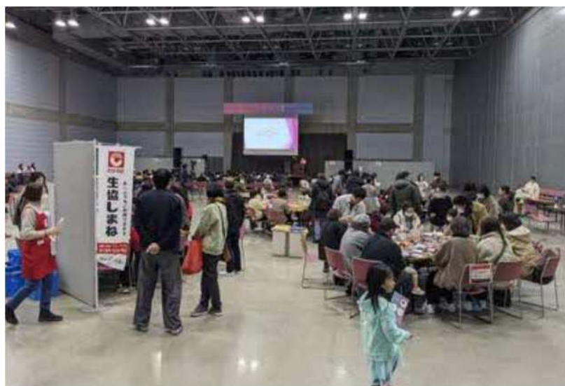
【図3 ワークショップ】