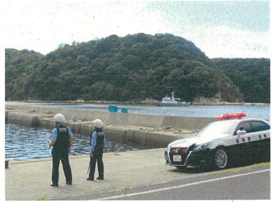
温泉津港テロ対策訓練