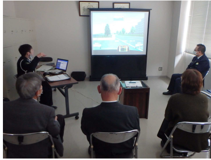
【運転者疑似体験型集合教育装置体験状況】