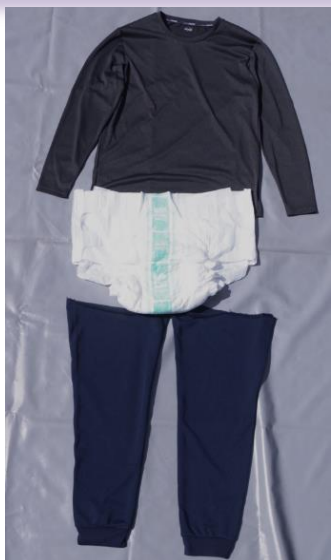
発見時の服装 *再現

上衣 黒色長袖Tシャツ (冷感素材) 下衣 紺色スウェットズボン (太股から足首まで) 紙オムツ(テープ止めタイプ)