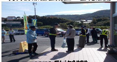
10/13 ラピタ多伎駅前 出前交通安全教室