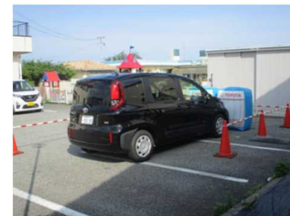
安全運転サポート車乗車体験