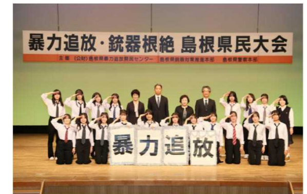
暴力追放・銃器根絶 島根県民大会