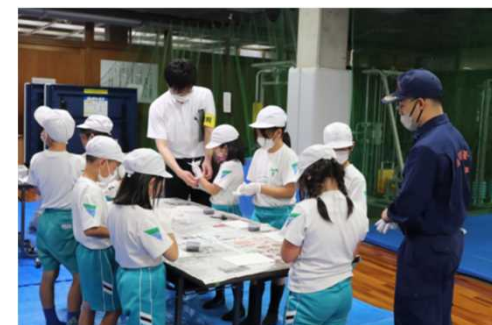
小学生による職業体験