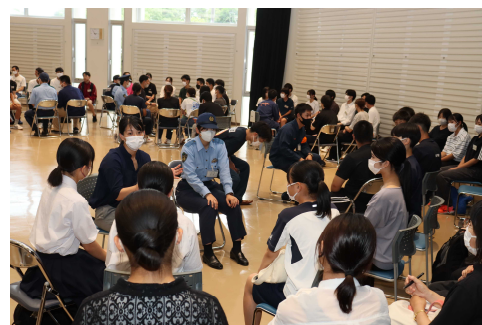
オープンポリスにおける座談会