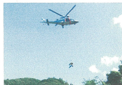
【7/13 ホイスト救助の状況】