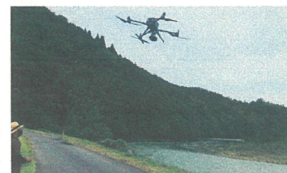
【8/9 ドローンによる捜索活動】