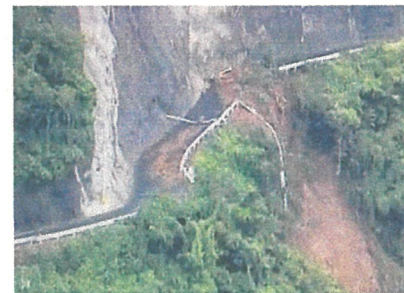
【7/7 ヘリテレ映像の状況】