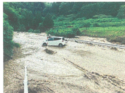
【7/12 濁流で身動きの取れなくなった車両】