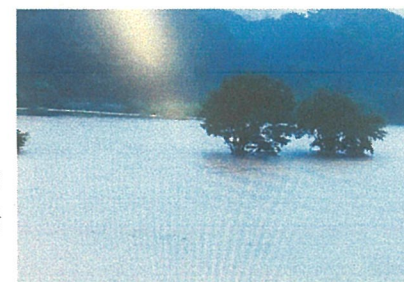
【8/14 モバイル映像（江の川）】

益田市（高津川）で行方不明事案が発生し、益田署員、広島県警ヘリ、民間ドローンが捜索実施