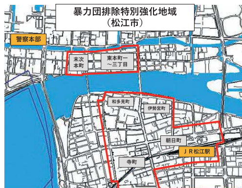
和多見町、寺町、伊勢宮町及び朝日町の区域 未次本町、東本町一丁目、東本町二丁目及び東本町三丁目の区域

※松江市については、玉湯町玉造の一部地域を含む（風俗営業等の規正及び適性化等に関する法律施行条例第10条表1で定める地域）