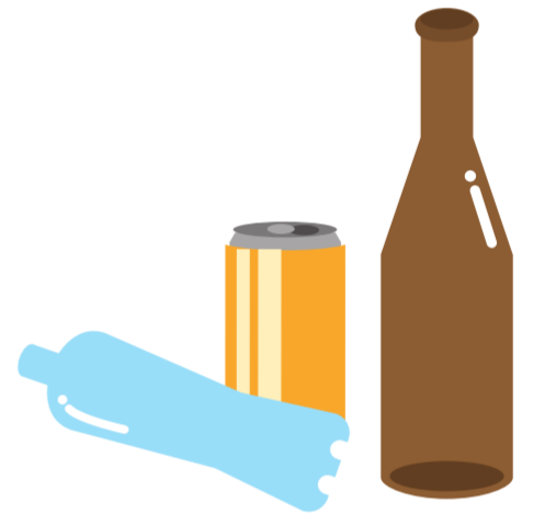
屋外に放置された空きビン・缶・ペットボトル