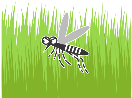
風通しの悪いやぶ・草むら

公園、学校、寺社、空海港、駅などの施設を管理されている方もご協力をお願いします!