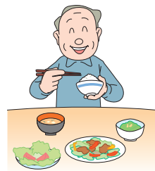
十分な休養と バランスのとれた栄養