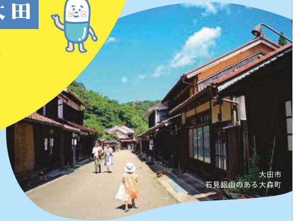
大田市 石見銀山のある大森町