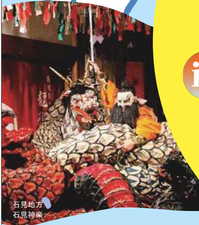
石見地方 石見神楽