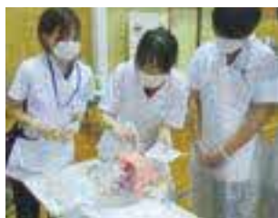
新人看護職員研修の様子1

また、2020年7月には、救急告示病院の認定を受けました。安来地域の中核病院としての役割を担えるよう良い医療をしっかりと提供し、市民の皆様から信頼される病院を目指します。