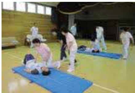
院内研修の風景（急変時対応）

医療を施す側にも、ぜひ若い力を注入して『より良い医療の実践と社会復帰の支援』に努めたいと考えています。