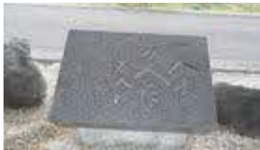
「一人は万人のために 万人は一人のために」 玄関写真

私は、学生時代に終末期看護に携わりたいと思い、当院に就職しました。仕事で困ったことがあってもだれにでもすぐに相談できる職場です。仕事のことだけではなくプライベートな話や悩みも先輩方に聞いてもらっています。患者様やご家族が本心を話してくださったときには、寄り添える看護を少しでもできたのかなとやりがいを感じています。自分の行っている看護は正解なのか日々悩みながら働いていますが、患者様からたくさんのことを教わり、看護の奥深さを感じています。