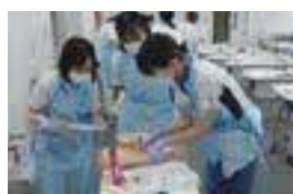
看護技術トレーニング(採血)

私たちは看護部理念に基づき、質の高い専門性のある看護の提供のために様々な研修や課題に取り組み、日々スキルアップを目指しています。新人研修では、看護の基盤づくりとしてコミュニケーションや院内のスキルアップセンターと連携し、看護技術の習得など1年を通し計画的に研修が行われます。また2年目以降もフラッグに沿ってそれぞれが実地指導者やリーダー研修などに参加しています。これらの研修が充実していたため、少しずつできることが増えているという実感と、臨床で看護を行う前にしっかりと技術を学べる場があったことはとても安心できました。また研修では同期とも会え、他部署で頑張っている同期に刺激を受けたり、励みになっています。