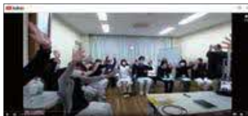
STプロジェクト企画