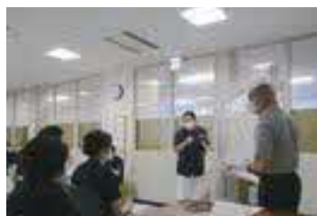
合同カンファレンス