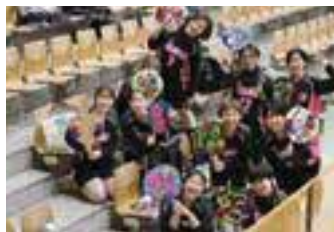
病院対抗バレーボール大会参加

私は新卒で加藤病院に就職しました。加藤病院で入院加療をされている患者さまは、様々な疾患を持って入院されるため、看護ケアについては幅広い知識が身につきます。また、勤務体制は2交代制で、残業も殆どないことから、プライベートの時間をしっかり確保でき、身体を休めることができます。研修体制については、院内においては定期的にスキルアップ研修があり、また、院外研修にも積極的に参加でき、スキルアップにつながります。加藤病院は個人の健康と成長を実現できる(ワーク・ライフ・インテグレーション)職場です。ぜひ、一緒に働きましょう!