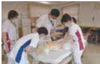
新入看護職員研修の様子