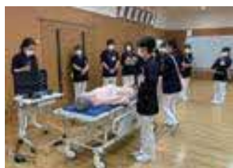
新人看護職員研修の演習の様子

看護師のキャリア開発支援として、引き続き認定看護師・専門看護師等の資格取得支援、特定行為研修指定医療機関としての研修受講費支援も行っています。