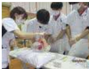
新人看護職員研修の様子2

私は現在精神科病棟で勤務をしています。精神疾患は、特に目に見えない部分があり、患者様との関わり方がとても大切であると感じています。また、安来第一病院は一般科も充実していて、幅広い領域を学ぶことができます。働くにあたって職場の環境や人間関係など不安要素は沢山あると思います。安来第一病院では接遇の向上はもちろん、充実した教育体制もあり、自己研鑽に励むことができます。私自身もこのような環境で働くことにより日々成長を実感することができています。看護師を目指す皆様と一緒に働くことができる日を楽しみにしています。