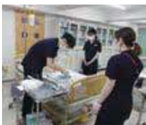
令和5年度新人研修の様子2