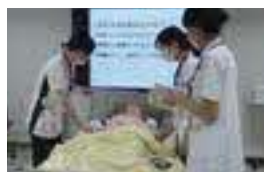
フィジカルアセスメント研修