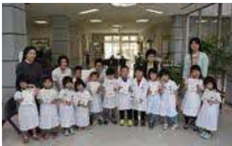
看護の日イベント

日原診療所（通所リハビリテーション併設） 介護老人保健施設せせらぎ 在宅診療所鹿足中央クリニック