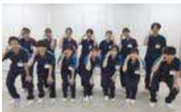
新人とプリセプター