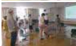
地域住民の健康を願って開催した「病院まつり」「市民公開講座」