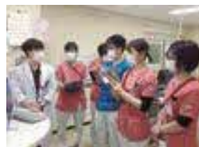
医師による直接指導

私は、地元出身で大学卒業後1年目から邑智病院で働いています。初めて看護業務に従事するという事で不安も大きかったですが、パートナーシップ・ナーシング・システムにより、常に相談できる先輩がいることで安心して看護業務に努めることができています。当院は、急性期病床と地域包括ケア病床を有しているため、様々な領域の疾病を学びながら退院支援に携わることが出来ます。また、院内の雰囲気や和やかでフレンドリーであるため、看護部はもちろんです。他にも話しかけやすく相談しやすい環境です。さらに、休暇が取りやすいため、旅行に行く予定も簡単に立てることができ、私生活も充実させることができます。私は、邑智郡内唯一の救急告示病院として働く中で、地域の方の役に立つことができていると感じています。私たちと一緒に思いやりのある看護を目指しませんか。