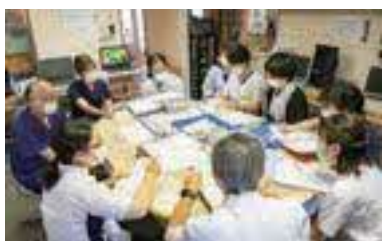
多職種連携カンファレンス

「自分を大きくしてくれた奥出雲町に恩返しをしたい!」「町民の健康を支えたい!」このような思いから大学で地域医療について学び、就職先として奥出雲病院を選択しました。病棟全体で新人を育てて下さる教育環境にあり、小さいことでも相談しやすく、優しい先輩達ばかりです。奥出雲病院では患者さんの抱える問題に対し、多職種連携のカンファレンスも行いやすく、多方面から患者さんに向き合うことで患者さんの目指す退院先やADLの改善に向け、みんなが一つとなり関わることが出来ます。大変なことや課題にぶつかるとはありますが、一人で抱えるのではなく気軽に相談できる先輩方や共に研修を受け、スキルアップを目指す同期達と一緒に大変だけど日々勉強しながら楽しく働いています。就職するまでぼんやりとしていた自分の目指す看護も奥出雲病院に就職したことでより具体的にになり、少しずつ自分のしたい看護を実践できるようになったかなと思います。一緒に奥出雲病院で働いて、自分のしたい看護・しかなかった看護をみつけませんか!