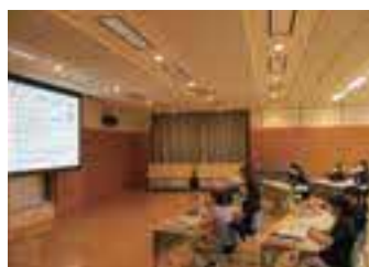
新人看護職員研修の講義の様子

松江市立病院では、新人看護師に心理的サポートをするプリセプターと看護技術などを指導する実地指導者が一人ずつつきます。その日うまくいかなかったことやできなかった看護技術も相談できます。また、新人看護職員研修では計画的に技術や知識をしっかりと学ぶことができ、その他の勉強会でも自分の興味のある分野について勉強できます。困ったときやどうしてもよいかかわらないときには先輩に相談しやすく、学びやすい環境になっています。