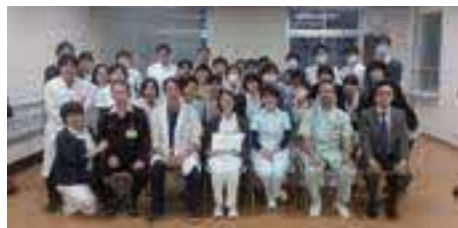
H26年度離島看護研修 修了式