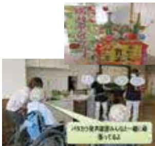
地域包括ケア病棟のフレイル予防を目的として病棟デイ活動