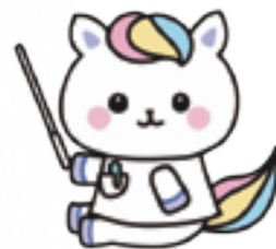
「看護の日」キャラクター かんごちゃん

※島根県ナースセンターは、1992年に「看護師等の人材確保の促進に関する法律」に基づき設置され、島根県看護協会が島根県知事の指定を受けて運営しています。