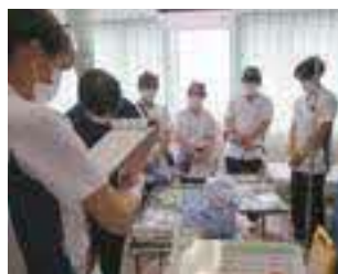
新人看護職員研修の様子