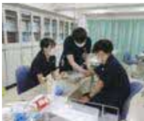
令和5年度新人研修の様子1

年間の公休は121日(令和5年)、年次有給休暇は半日単位の取得が可能で年間5日以上必ず取得できます。また育児、看護・介護休業等もあり、特に女性の育児休業の取得は100%です。他にも子の看護休暇・家族の介護休暇は前記の年次有給休暇とは別に時間単位で年間40時間取得可能です。ワークライフバランスを大事にし、働きやすい職場環境づくりに取り組んでいます。