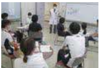
リフレクション研修

医療の質向上のため、各専門職が得意分野を活かして学習内容を準備し、全職員がオンラインにて受講する研修も実施しています。