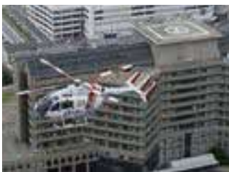
ドクターヘリと島根県立中央病院

「島根県の救急の最前線で看護がしたい」そんな気持ちを看護局や家族に応援してもらい、ICU、救急外来、DMAT、フライトナースとしてキャリアを重ねてきました。大変なイメージのある救急の現場ですが、頼れる同僚と互いに支え合いながら、患者さんと向き合い、看護の楽しさを日々実感しています。