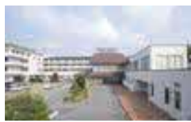
益田地域医療センター医師会病院

急性期から回復期、維持期まで、また老健施設や訪問看護など、将来のキャリア形成や家庭の状況などに応じて、あなたの目指す看護、あなたに適した看護に従事できます。