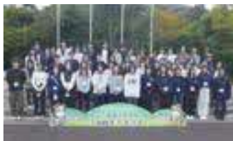
三瓶リフレッシュ研修

急性期医療・高度先進医療・周産期医療・がん医療・外傷救急医療の体制を充実していくために、病院の役割・機能、職場環境の改善・充実を図りながら、各職種が医療チームの一員として、それぞれの専門性を発揮し医療の質の向上を目指しています。