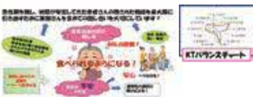
最期まで食べられる口を目指したKTバランスチャートを活用した食支援

住み慣れた地域で安心して療養できる環境の提供を目指している地域密着型の病院です。