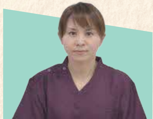
松ヶ丘病院 看護師・勤続5年・30代