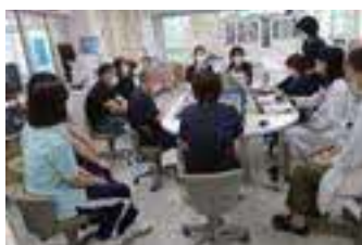
多職種カンファレンスの様子

私は令和2年度に入職しました。精神科のイメージとして、看護技術が身に付かないのではと不安がりましたが、新入者研修を受けることで安心できました。また近隣の病院、看護協会などの院外研修に参加し、他の病院の方と様々な学びを共有することができました。教育体制として、院内研修、プリセプター制度があり、新人でも安心して業務に取り組むことができます。また、精神科と聞くと怖いイメージもあると思いますが、CVPPPといった、暴力に対する研修も実施されており、患者様もスタッフも安心して過ごせるような取り組みが行われています。デイケア、訪問看護とも連携し、入院中の患者様が住み慣れた地域で過ごせるようになんて頑張っています。