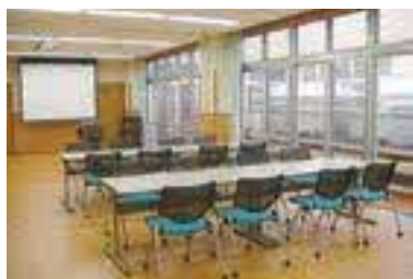
グループワークの充実・人材育成

当院は、鶏塚古墳や八重垣神社に代表されるように古代文化から歴史ある土地に「勢よく湧き立つ幾重もの雲のように、時に患者さんが社会の冷たさから身を守り、心の疲れを癒すオアシスとしてほしい」と願いを込めて開院いたしました。現在は、「私たちは『こころの声』を大事にします」「私たちは医療水準の向上に努めます」を基本理念として地域の医療ニーズに対応する病院を目指して、理念を遂行し、地域社会に貢献できるように努めております。また、当院では、安心して働ける職場環境を目指し、職員のワークバランスに合わせた勤務形態に柔軟に対応しており、仕事との両立がしやすい職場環境作りに努めています。