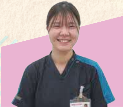
大田市立病院 看護師・勤続5年・30代

私は一昨年、双子を出産した後、育児休業を1年間取得し職場復帰しました。復帰してからは仕事に育児にと慌ただしい日々を送っています。私は、妊娠中から家族と仕事復帰後の生活について話し合ってきました。