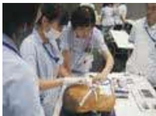
入社から10回/年は、毎月1回、新人看護師が全員集合してのフォローアップ研修があります(勤務時間内)

就職先に悩んだ時に、インターンシップに参加しました。職場の雰囲気もアットホームで、患者様へ丁寧に対応し寄り添う姿が印象的なこともあり、当院への就職を決めました。1年目は、毎月行われる新人研修に参加し、知識や技術を身に付けて現場に役立てることが出来ました。2年目以降も、すぐに実践できる研修が多く、安心して働くことができています。先輩が丁寧に指導・サポートしてくださるので、日々勉強になります。2交代制なので、まとまった休みもあり、自然豊かな場所で、プライベートも満喫しています。