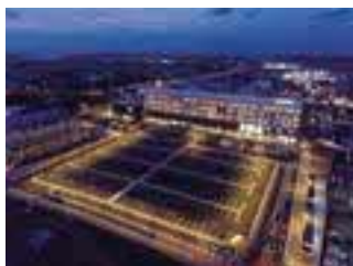
圏域の医療を24時間支えています

当院は、地域に密着した急性期医療を担う病院です。圏域で唯一のお産ができる医療機関として、地域周産期母子医療センターに指定されているほか、災害拠点病院、地域医療拠点病院等に指定され、救急医療・がん医療・母子医療・地域連携・災害救護活動などに取り組んでいます。私達は、地域の皆様や患者様の声に耳を傾け、安心・安全な医療・看護を提供できるよう、日々努力しております。また「人々の生命と健康、尊厳を守り、苦痛の予防と軽減に努める」ことが実践できる赤十字看護師を育成するために教育・研修に力を入れ、一人ひとりの成長を丁寧にサポートしていきます。地域を取り巻く医療情勢が刻々と変化の中で、看護職に求められていることを敏感にキャッチし、皆で力を合わせて進化し続ける組織でありたいと考えています。