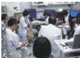
カンファレンスの様子

また、職員が働きやすい職場作りのため福利厚生にも力を入れており、独自支援制度を設けて、子が小学校就学始期に達するまで育児短時間勤務制度を、介護では最大5年間までの短時間勤務制度を設けております。平成24年開設の院内保育所では、夜間保育及び休日の一時保育に加え、職員の要望に応え学童保育も導入しました。職員が安心して仕事に打ち込めるよう、今後も環境を整え、地域医療の発展に繋げて行きたいと考えています。