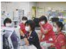
診療看護師による定期的な勉強会