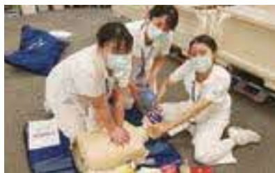
BLS 研修風景 先輩看護師と共に協力している様子！

困ったときに声をかけてくれる先輩看護師がいるから頑張っています。できないことがあっても「一緒にしよう！」と先輩看護師がいてくれる安心感があります。