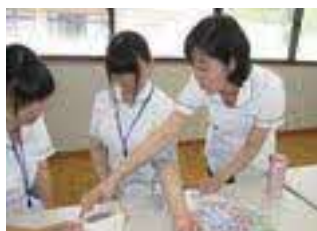
高校生の看護体験

“生活の場”であるセンターは、ゆっくり、じっくり関わり、その人らしさが輝くふつ々の生活を一緒に見つけていける魅力があります(歴30年)。