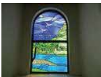
病棟ステンドグラス