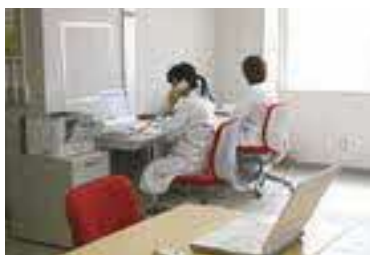
リハビリ部門・地域ネットワーク作り

私は一般精神科病棟で勤務しています。日々、患者様が安心して過ごしていけるように、心に寄り添う看護を心がけています。八雲病院に就職したきっかけは、見学の時、病院内で働いておられる職員の雰囲気、とても良いと感じたからです。看護学校を卒業したばかりで、右も左もわからない状態での入職でしたが、指導して下さる先輩看護師に丁寧に教えていただいたおかげで、少しずつですが自信を持って、仕事に取り組むようになりました。1年目という立場ですが、無理のない範囲でいろいろなことにチャレンジしていける環境にも配慮していただいています。今後も、疾患などについて知識を深めていきたいと思っています。