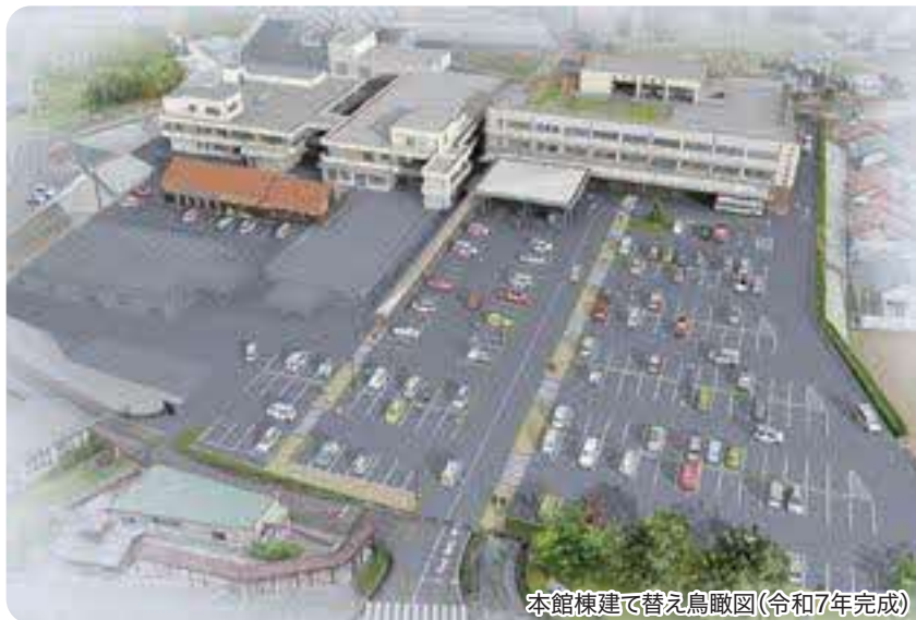
本館棟建て替え鳥瞰図(令和7年完成)