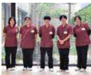
令和5年の新規採用者

福利厚生も充実し働きやすい職場です。平成26年4月より社会保険病院・厚生年金病院・船員保険病院は、独立行政法人地域医療機能推進機構が直接運営する病院グループとなりました。