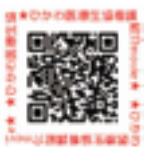
ひかわ医療生活協同組合 斐川生協病院 紹介動画