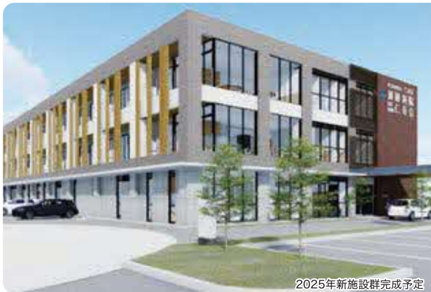
2025年新施設群完成予定