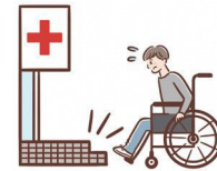
環境面に障壁がある時 (例：段差により出入りができない)