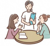
意識面に障壁がある時 (例：会話がしづらい)