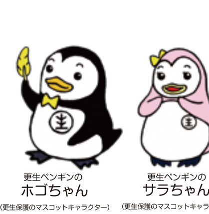
（更生保護のマスコットキャラクター）

保護観察又は更生緊急保護対象者を、その事情を理解した上で雇用し、改善更生に協力する民間の事業主。