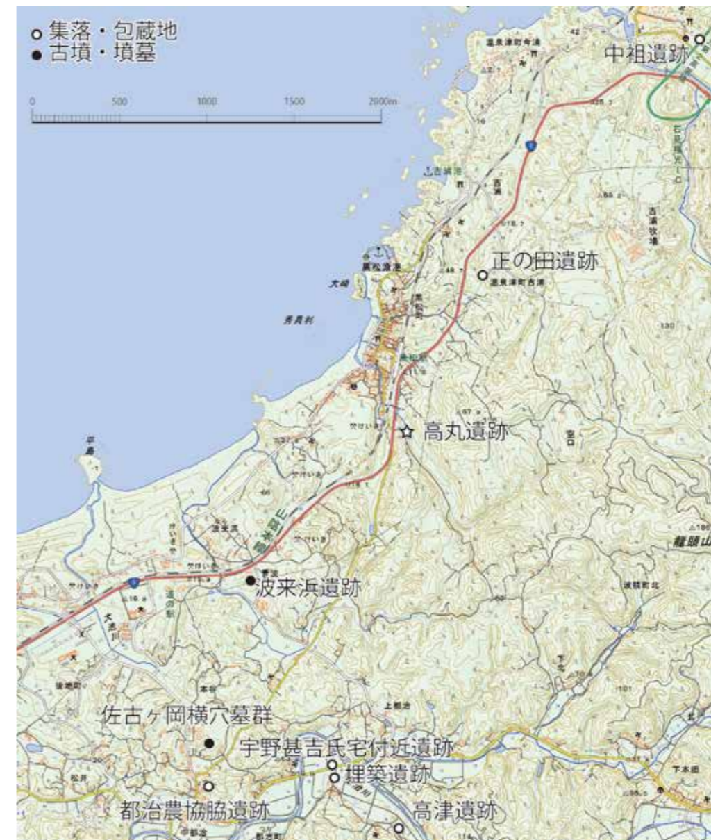
高丸遺跡の周辺の遺跡

編集・発行 島根県教育庁埋蔵文化財調査センター 〒690-0131 松江市打出町33 TEL：0852-36-8608 FAX：0852-36-8025 Email：maibun@pref.shimane.lg.jp http://www.pref.shimane.lg.jp/maizobunkazai/