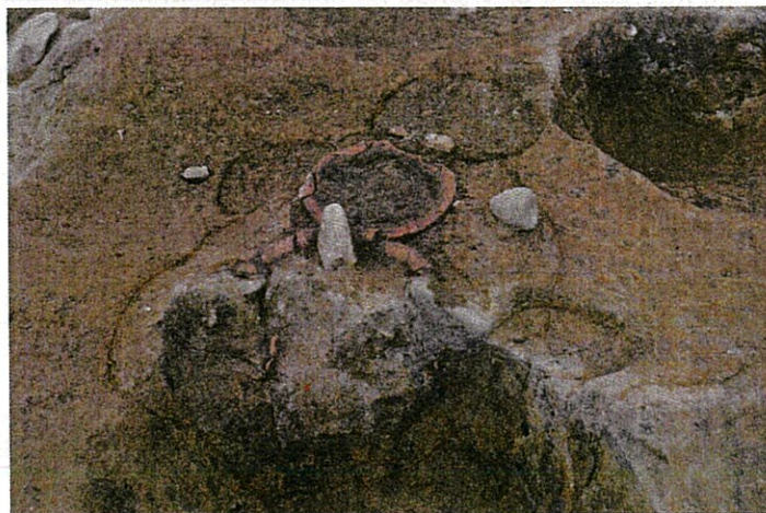
土器埋設遺構検出状況