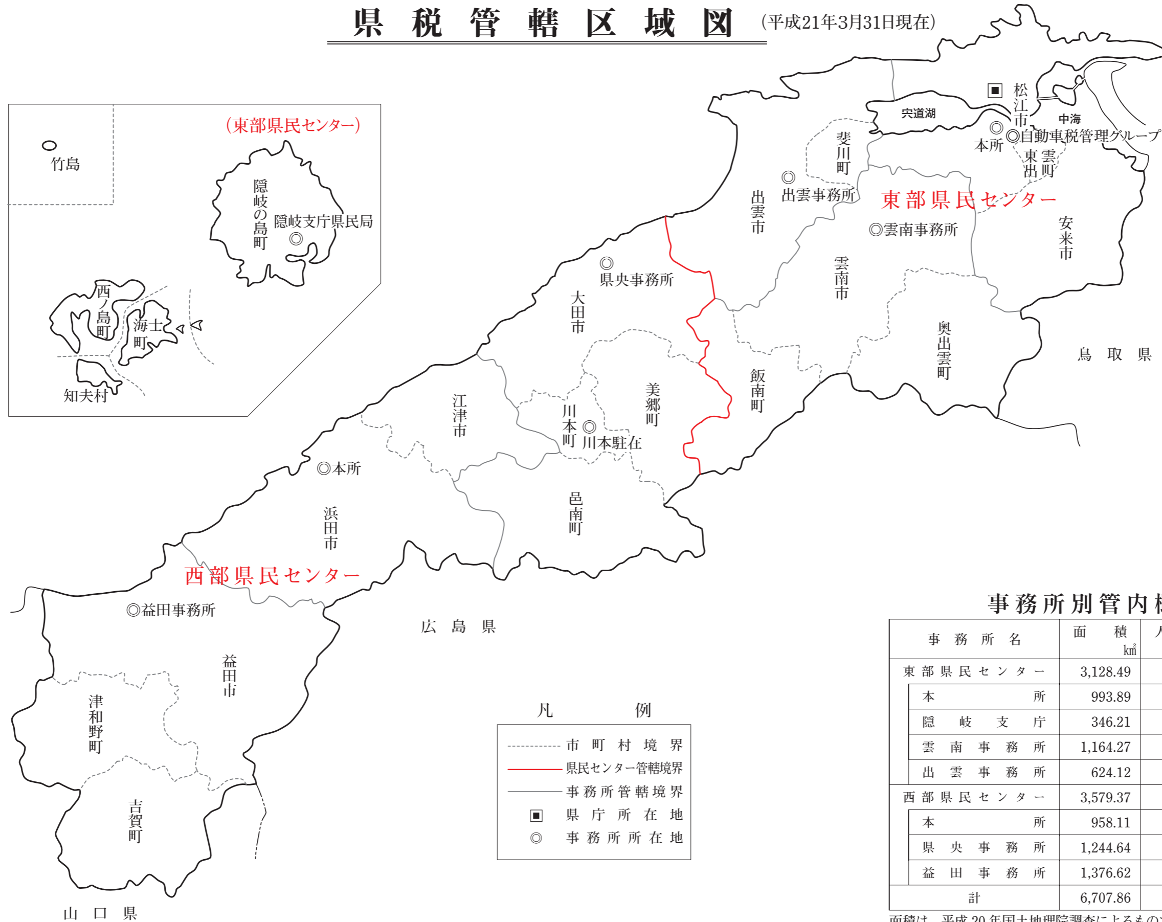
事務所別管内概況