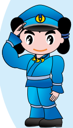
鳥根県警察 シンボルマスコット みこびーくん