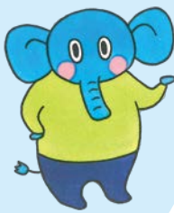
鳥根県消費者センター マスコットキャラクター だまされないゾウくん