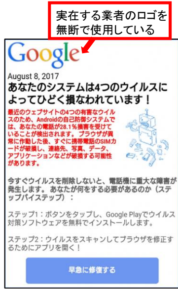
スマホに表示された警告画面の例