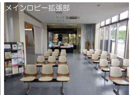
メインロビー拡張部