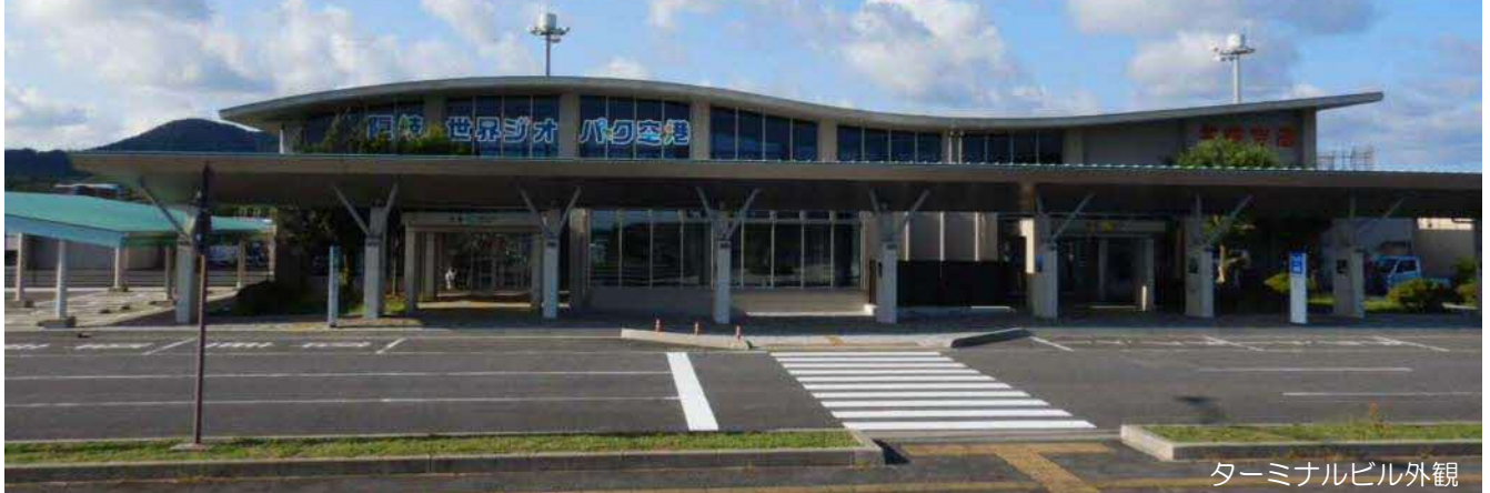
ターミナルビル外観