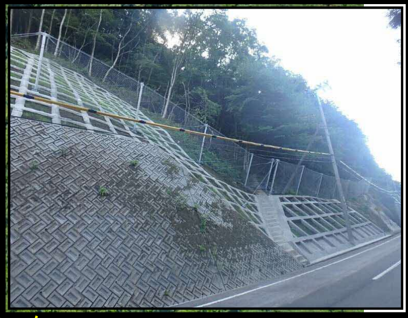
高エネルギー吸収柵 (杭基礎タイプ) L=57m