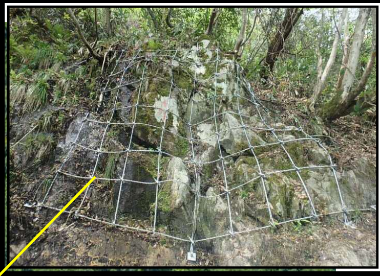
予防工(ロープ伏工)