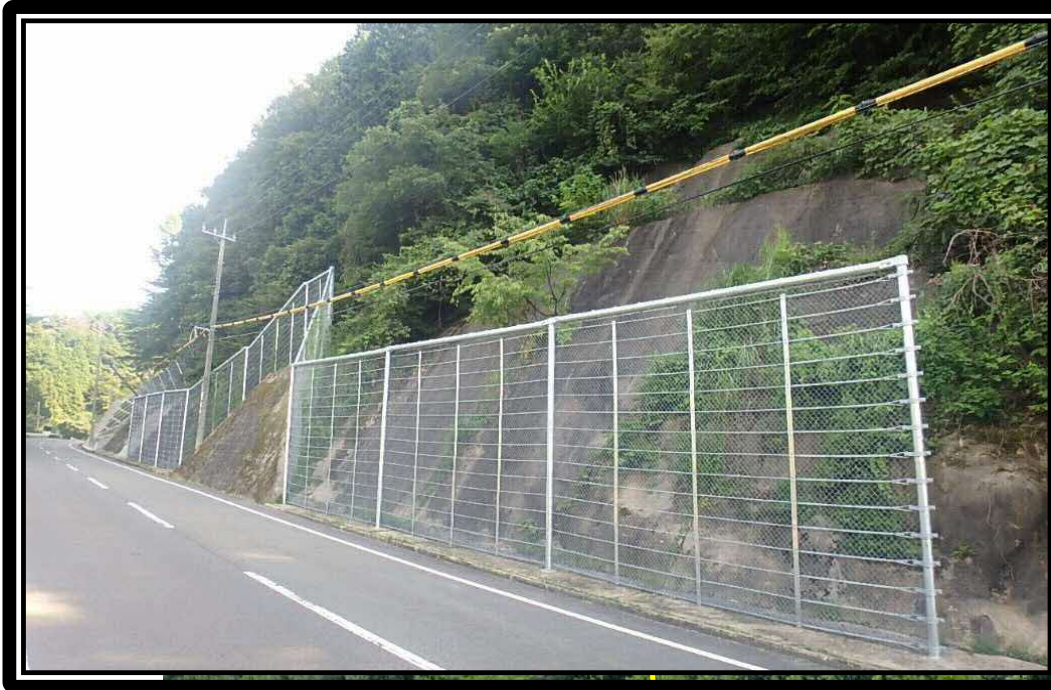
高エネルギー吸収柵 (アンカー式斜面タイプ) L=59m

表彰区分 所長表彰 部門 農林水産部門 工種 農業土木 事務所名 県央県土整備事務所