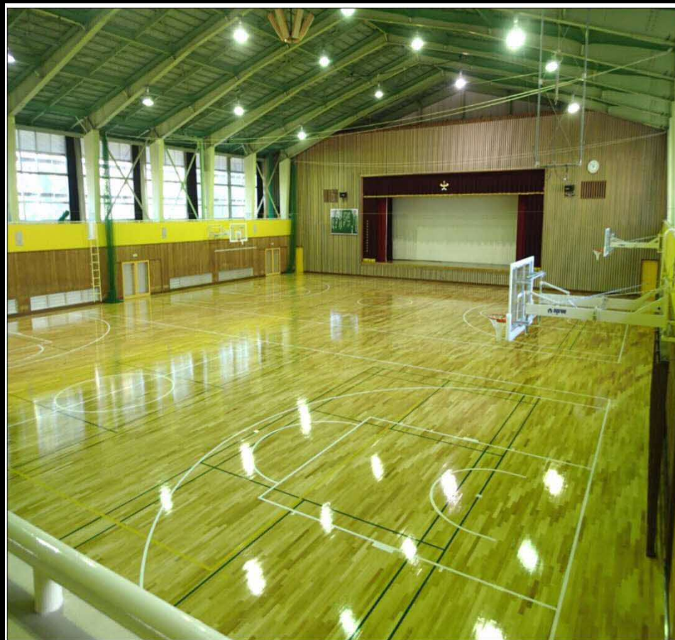
完成 アリーナ全景