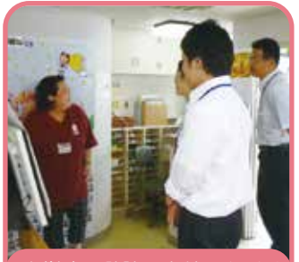
大学生も勉強に来館しました!