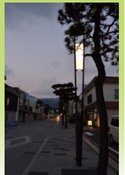
電線地中化と照明の新設