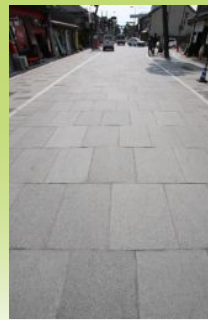
通りの全面石畳に