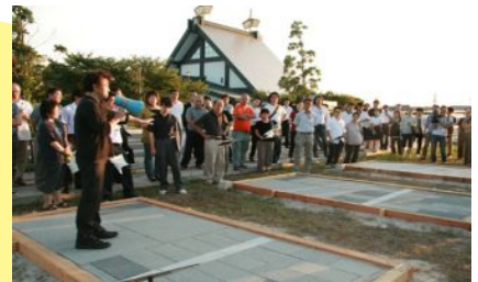
石畳の質感や配色を実物を用いて比較検討