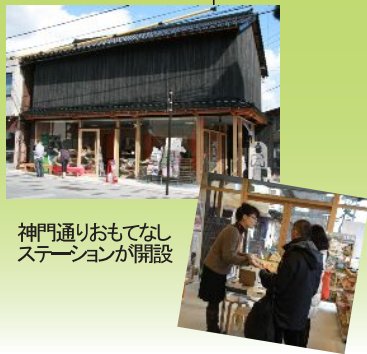
神門通りおもてなしステーションが開設