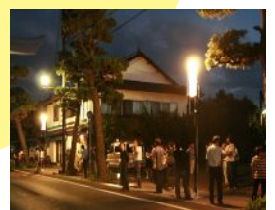
照明は試作の段階で通りに設置して確認