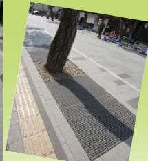
松の足元は雨水が浸透するように