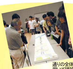
通りの全体模型を用いて議論をした