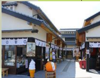
ご縁横丁がオープン