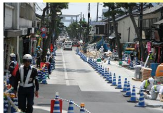
石畳の設置が沿道のみなさんの協力のもと進められた