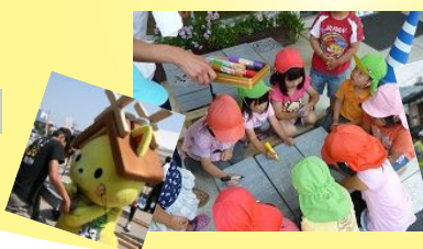
石畳を貼っていく過程では石畳の裏にみなさんからメッセージを記入してもらった