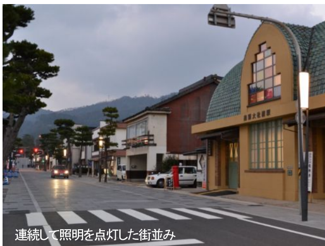
連続して照明を点灯した街並み

神門通りに新しい照明18基が設置されました。電線の地中化によって街並みがすっきりした中で、凛とした雰囲気照明のデザインは、通りを歩く観光客の方々、地元の方々にも好評をいただいています。夜には松と一直線に並んだ照明のやわらかな明りが連続し、街並みに魅力が加わりました。