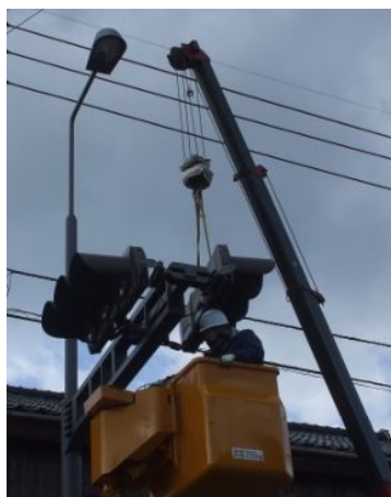
信号と照明が複合