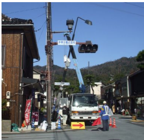
既存の信号を撤去し、新たな信号に