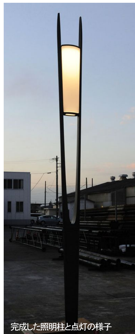
完成した照明柱と点灯の様子