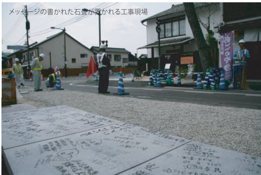
メッセージの書かれた石畳が置かれる工事現場

また、工事に併せて、神門通りPR館で石裏にメッセージを書ける取組も始まりました。地元の方々や観光客の方々には、これから敷き詰められる石畳の裏面に、願いや道への思いなど、思い思いのメッセージを書きいれていただいています。はたして何十年後にかこのメッセーが見られることがあるのか、書き入れたみなさんは、遠い未来に思いを馳せています。この取組は6月中旬ごろまで実施する予定です。突然の訪問でも可能ですので、より多くの方々に思い出を残してほしいと思います。