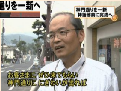
2012年5月7日 TSKスーパーニュースで取り上げられました