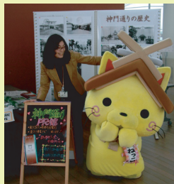
エントランスで神門通りPR館の宣伝

決起集会に参加される方もですが、でんでん虫(図書館)を訪れる市民の方も多く、『一見さんの多い神門通り』とは違いましたね。年代によって、大社に対する想いも、肌で感じてきた時代感も、全く違い新鮮で羨ましい思いでした。『おもてなし力』、それは誰に教えられる事ではなく、郷土に対する想い入れや誇り、日本人として培った自分のアイデンティティーの確立が『原動力』となっているのであろうと思いました。