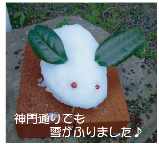
神門通りでも雪がふりました♪

Ameba 神門通りPR館「ブログ」 twitter 神門通りPR館「ツイッター」