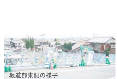
坂道部東側の様子