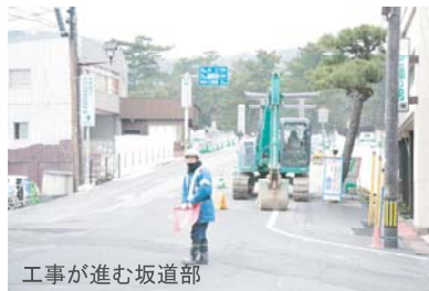
工事が進む坂道部