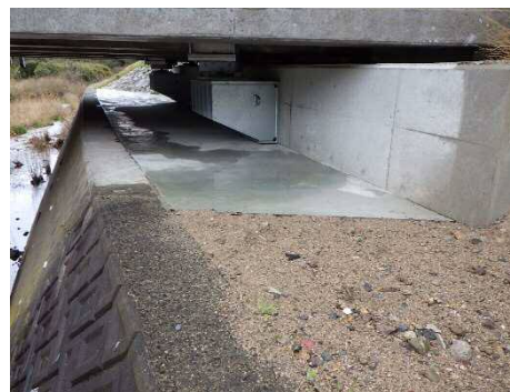
令和4年度完了 橋台部