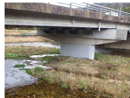
令和4年度完了 橋脚部