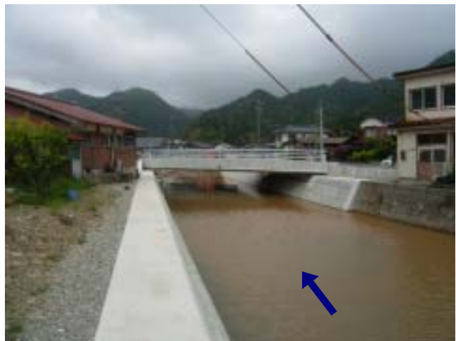
竣工写真(下流側より) 「H21.05.27 撮影」