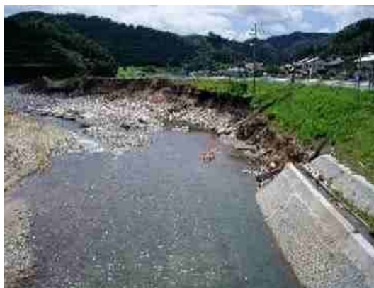
一般国道 184号 (梅雨前線豪雨；飯南町)