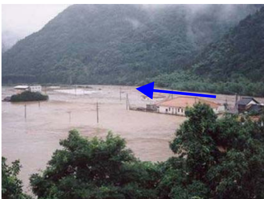
一級河川 神戸川 (梅雨前線豪雨；出雲市)