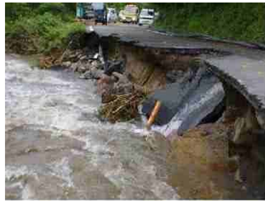
一般県道 印賀奥出雲線 (梅雨前線豪雨；奥出雲町)