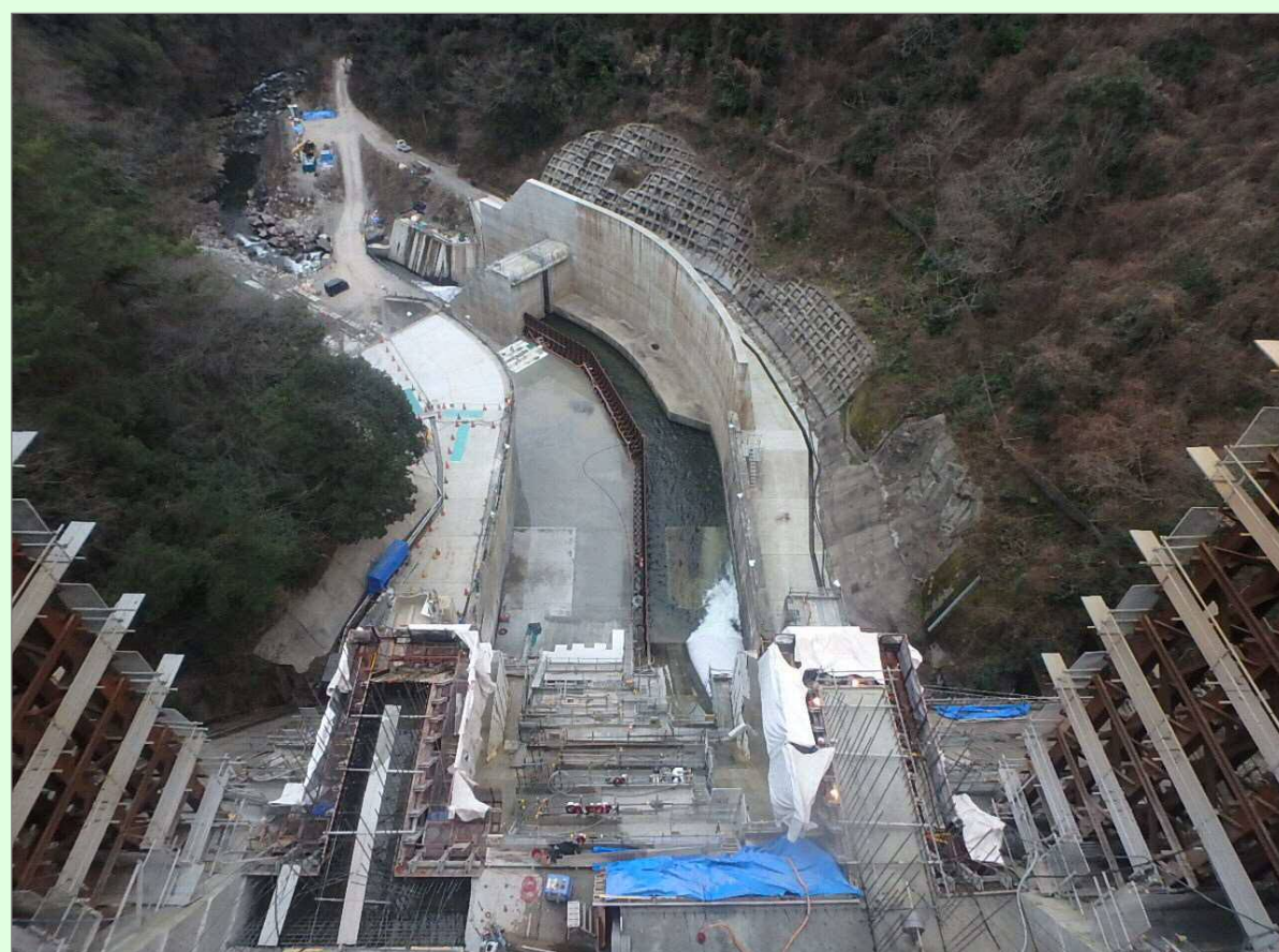
減勢工・工事用道路