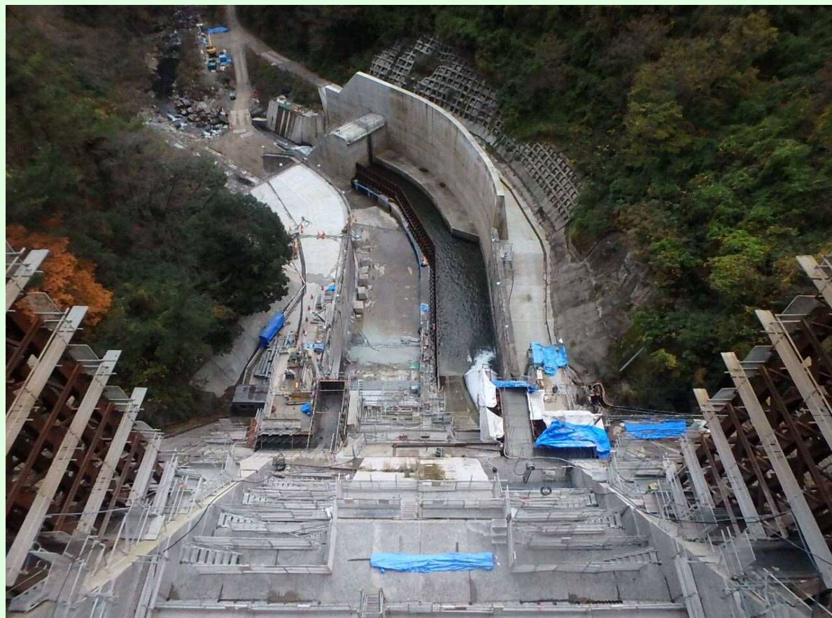
減勢工・工事用道路