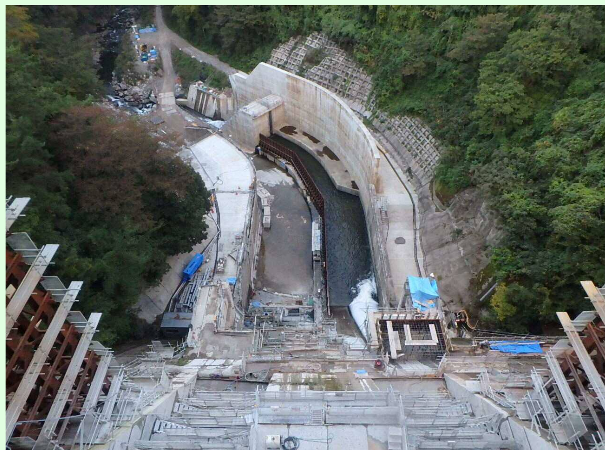
減勢工・工事用道路