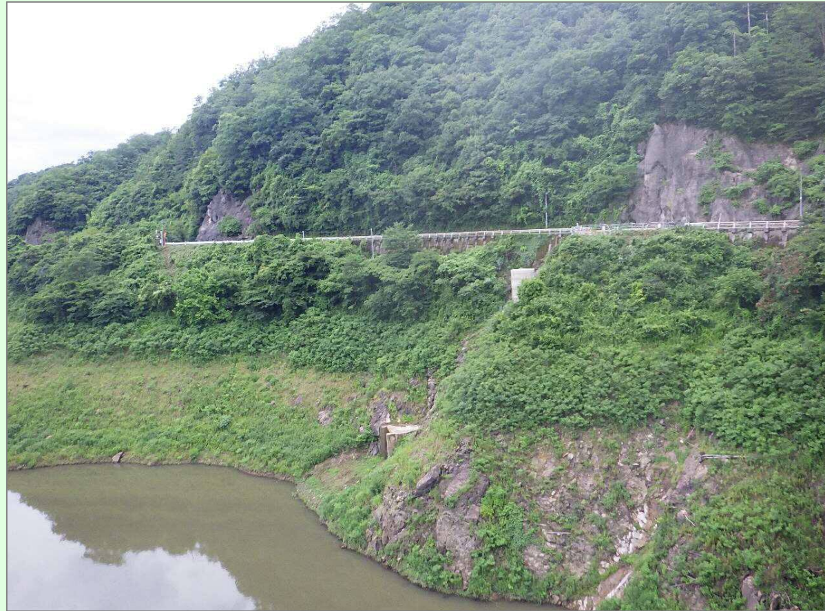
取水塔撤去施工状況