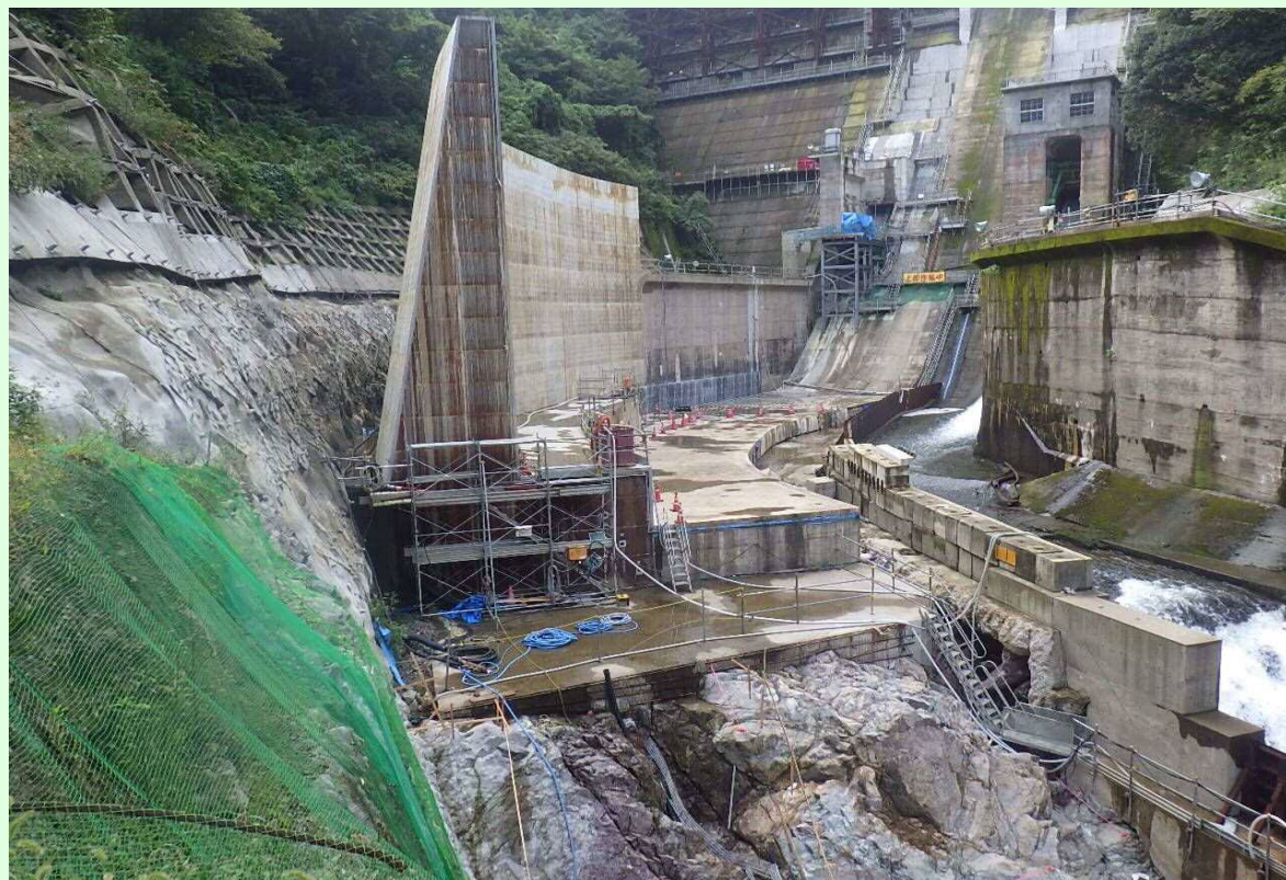
右岸副ダム施工状況