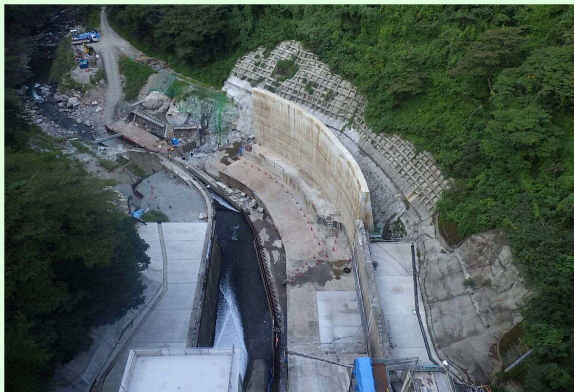
減勢工・工事用道路