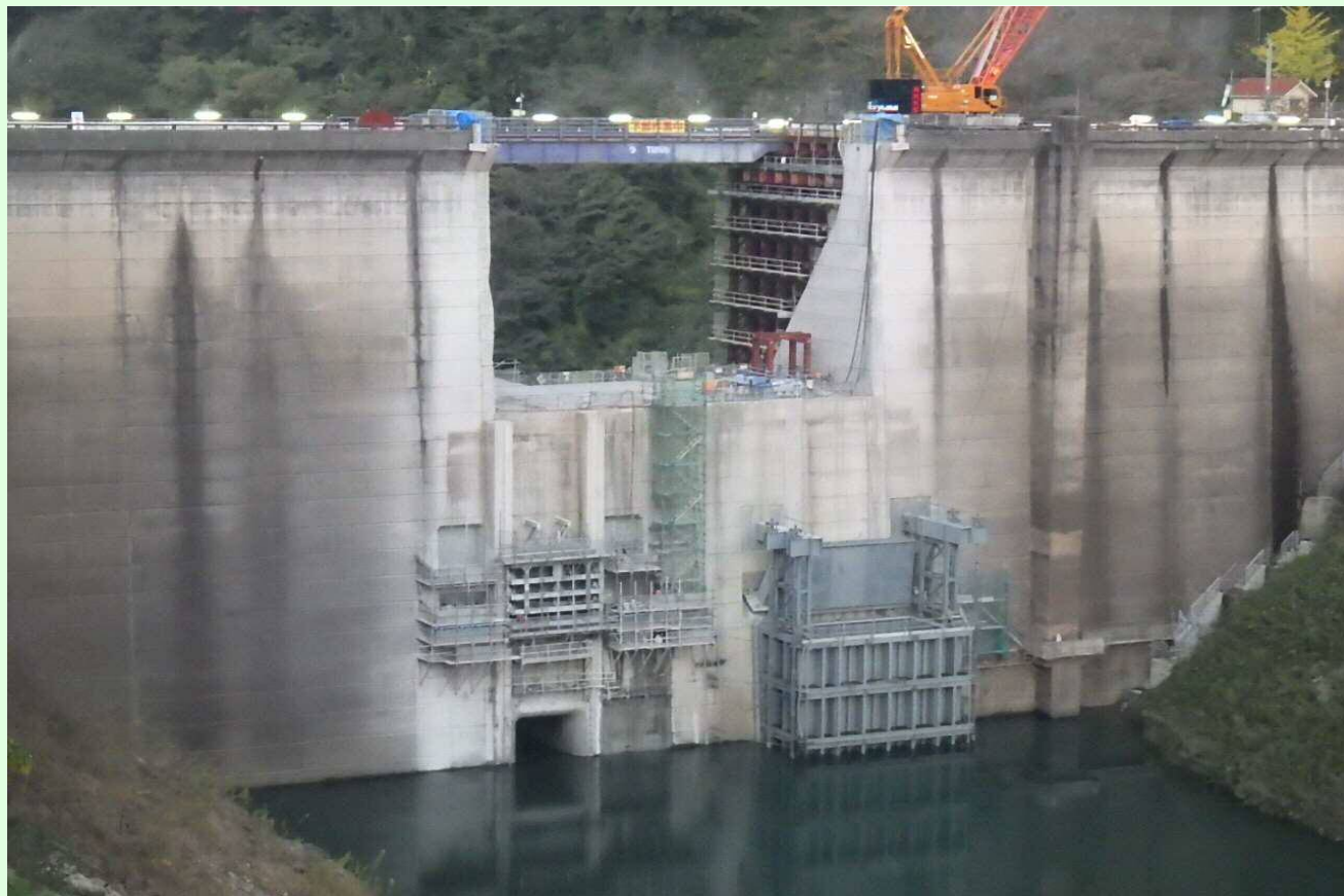
上流仮締切施工状況