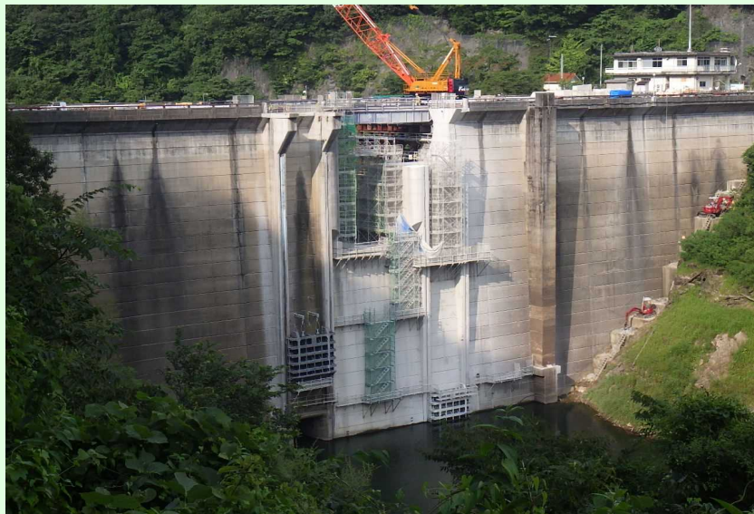
堤頂部既設取壊し状況