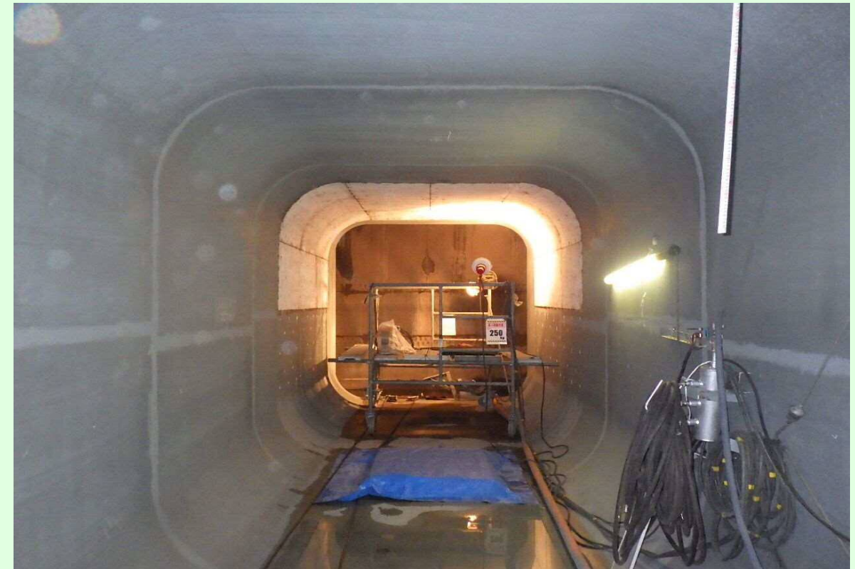
右岸放流管改造状況