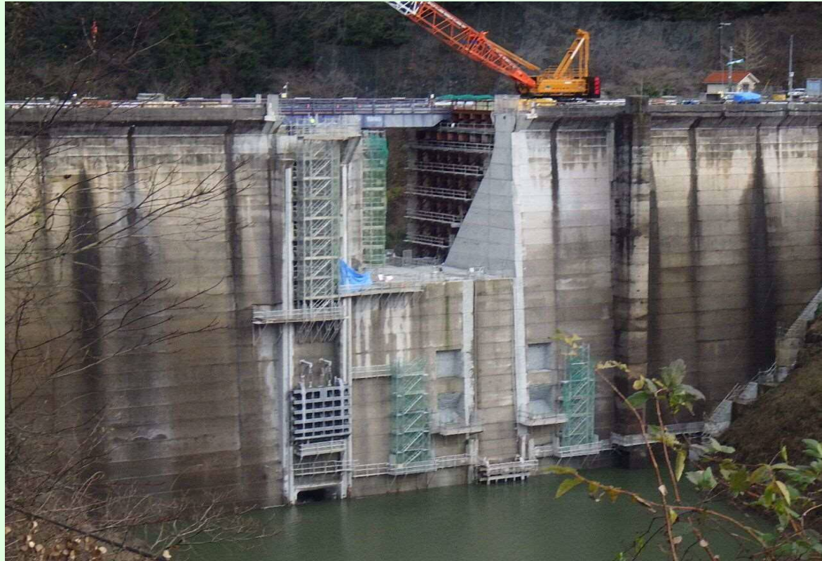
堤頂部既設取壊し状況