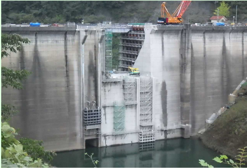
堤頂部既設取壊し状況