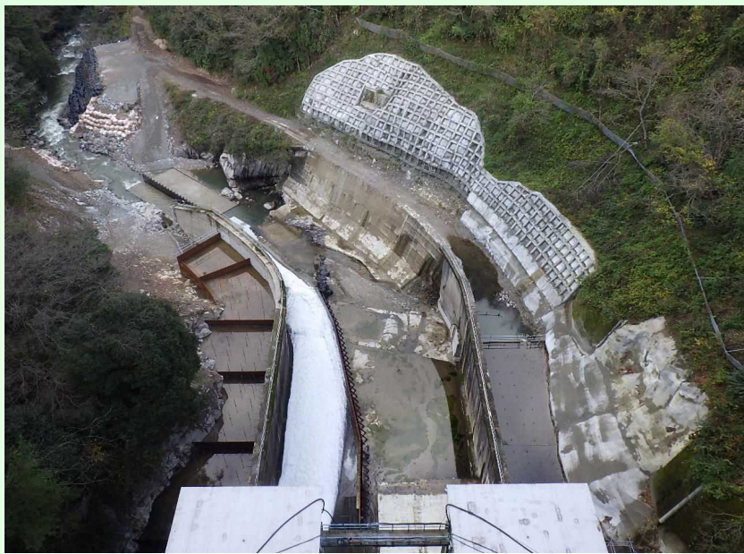
減勢工・工事用道路