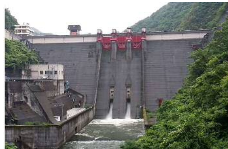
さくねんど ほうりゅうじょうきょう 昨年度の放流状況