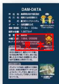
ダムカードの配布方法