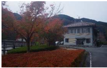
管理所周辺展望所