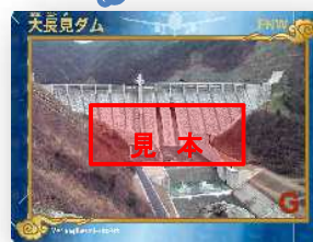
※萩・石見空港限定ダムカード