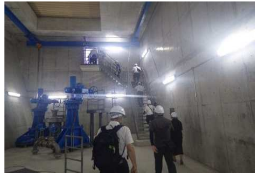
ダム内部の見学会の様子

説明後には、皆さまから笑顔で「ありがとうございました。ありがとうございました。」という言葉をいただき、大変うれしく思いました。