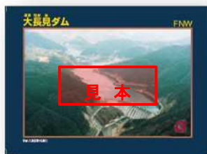
※通常のダムカード