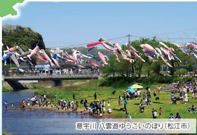
意宇川 八雲遊ゆうこいのほり(松江市)