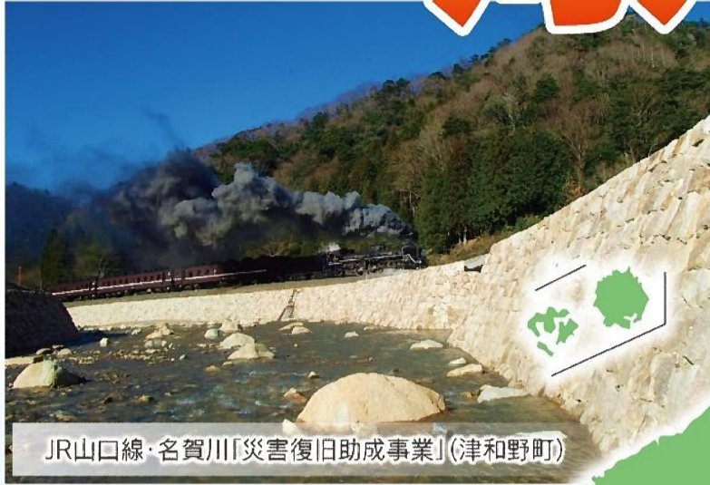
JR山口線・名賀川「災害復旧助成事業」(津和野町)