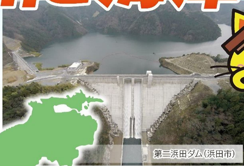
第三浜田ダム(浜田市)