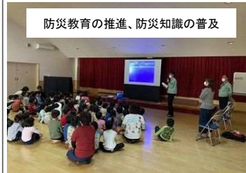
防災教育の推進、防災知識の普及