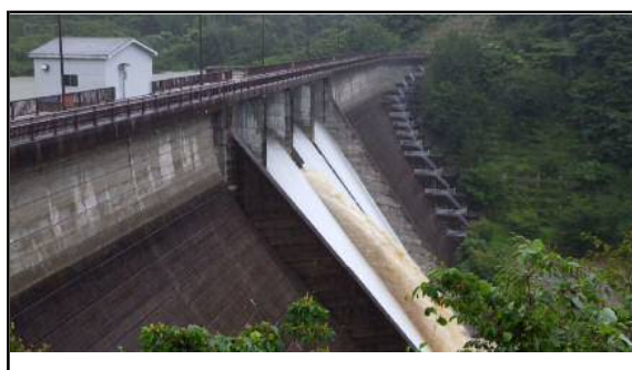
所在地: 島根県隠岐の島町原田